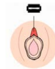
ዓይነት I የቂንጥር መቁረጥ (Clitoridectomy)