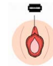
ዓይነት II የብልቱን ከንፈር መቁረጥ (Excision)