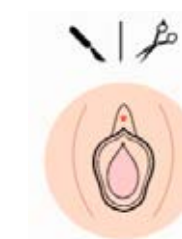
ዓይነት IV የተለያዩ ድርጊቶች

የስነ አምዕሮ ተጽእኖዎች በድብርት፣ የባህሪ መዛባት፣ የፍራቻ ምላሾች እና የወሲብ መዛባት ናቸው። ጥቃቱ እና የሞት ፍራቻው ተዋክሮ በጣም ብዙ ጊዜ የከፋ የስሜት ቁስል ያስከትላሉ። ብዙ ጊዜ የተጠቁት ግንኙነት ላይ አምነት የማጣት እና ግንኙነት የመፍጠር ችግር አቅም ያለማግኘት ችግር ያጋጥማቸዋል። ተጽእኖዎቹን አፍኖ መያዝ፣ ተስፋ መቁረጥ እና ማህበራዊ ግጭት ተግባር ከትውልድ ወደ ትውልድ ይተላለፋል።